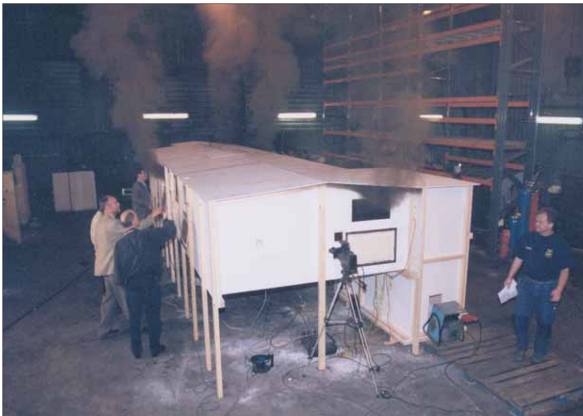
En bild från det omfattande rekonstruktionsarbetet för att fastställa brandförloppet. Forskare och tekniker vid Sveriges Provnings- och Forskningsinstitut i Borås byggde upp en skalenlig modell av brandfastigheten för att tillsammans med polisens tekniker kunna studera hur en brand i lokalen utvecklas under skilda förutsättningar