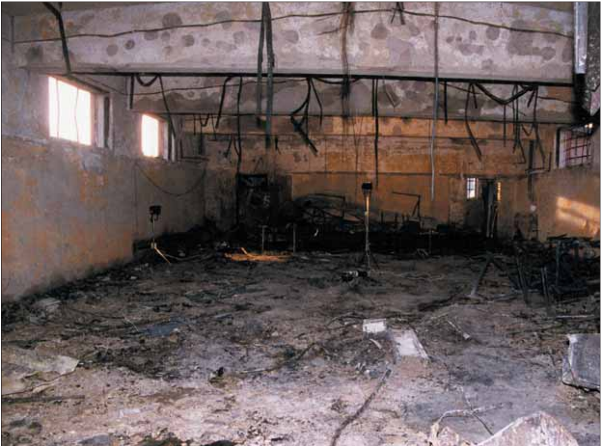
Interiörbild som visar den inre delen av diskotekslokalen. Vid den borte väggen finns resterna av scenen. Dörröppningen till höger är den nödutgång som leder till det trapphus, där elden startade. Det var i detta trapphus de nu häktade ynglingarna uppehöll sig strax innan branden förvandlade lokalen till ett inferno.

rättelserotel, som hade att jämföra materialat med inkomna förfrågningar om de döda och skadade.