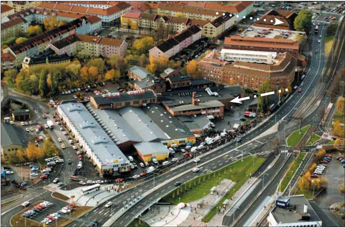
Flygbild över brandplatsen och dess belägenhet. Diagonalt i bilden löper Hjalmar Brantingsgatan i öst-västlig riktning. I bildens mitt ligger diskoteksbyggnaden – byggnaden med den höga skorstenen vid den streckade pilen. Byggnaden högst upp till höger i bilden, vid den prickade pilen inrymmer polisstationen på Hisingen.