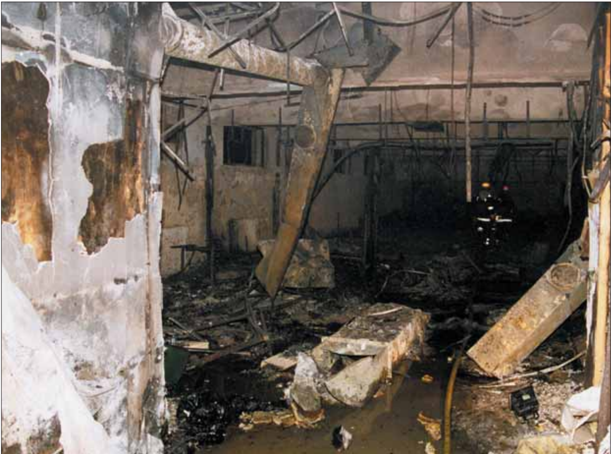
Interiörbild från den utbrända diskotekslokalen. Bilden är tagen från passagen vid trapphuset i riktning in i diskotekslokalen där allt brännbart blivit aska. Innertak och ventilationstrummor har rasat ner. I passagen omkom många ungdomar när de fastnade i trängseln.

som levde och de som låg döda och skadade. Nyheten hade redan spridits och oroliga föräldrar och kamrater försökte ringa till ungdomarna som var på diskoteket. Oroliga människor strömmade till platsen mitt i natten. Vissa av oro för sina barn, andra av medkänsla och nyfikenhet.