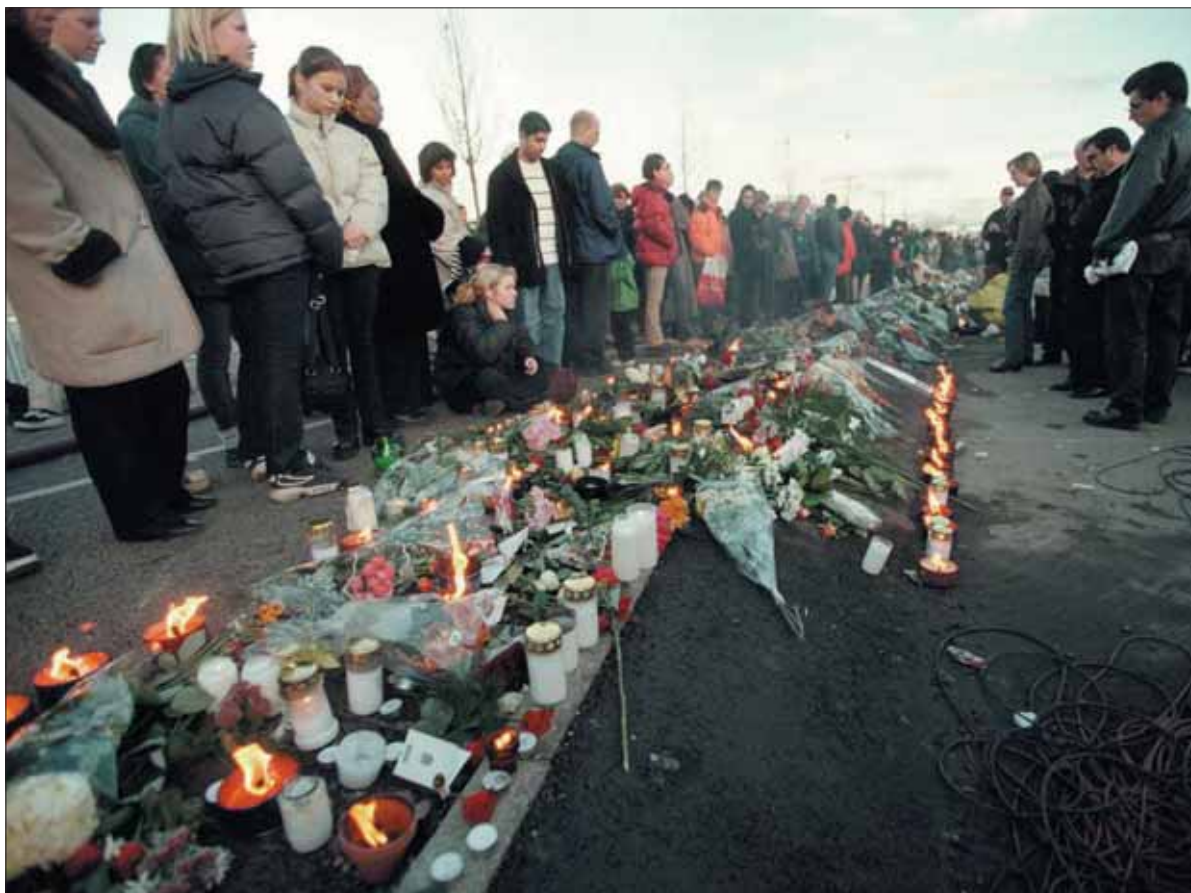
Längs brandfasaden växte antalet ljus och blommor som anhöriga och andra sörjande lade ner i flera veckor efter katastrofen och kommunstyrelsen i Göteborg beslöt att låta platsen vara fredad under ett år.

räddningstjänsten fick utrymme för brandbilar och ambulanser. Brandbefälet beslutade omedelbart att brandmännens insatser enbart skulle inriktas på livräddande åtgärder, varför allt släckningsarbete utblev i början. Vatten användes endast för att skydda rökdykarna i deras livräddningsarbete.